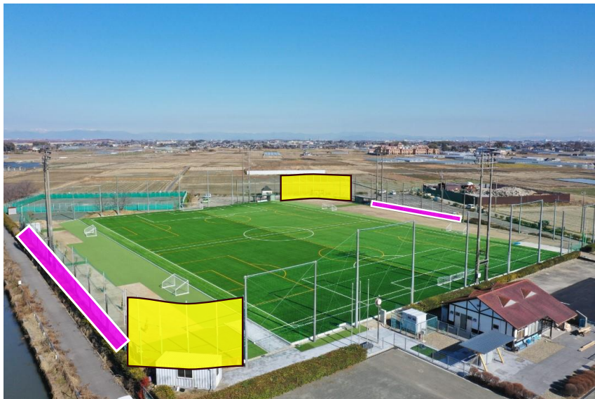
図 2：掲示可能箇所（バックネット・金網フェンス）